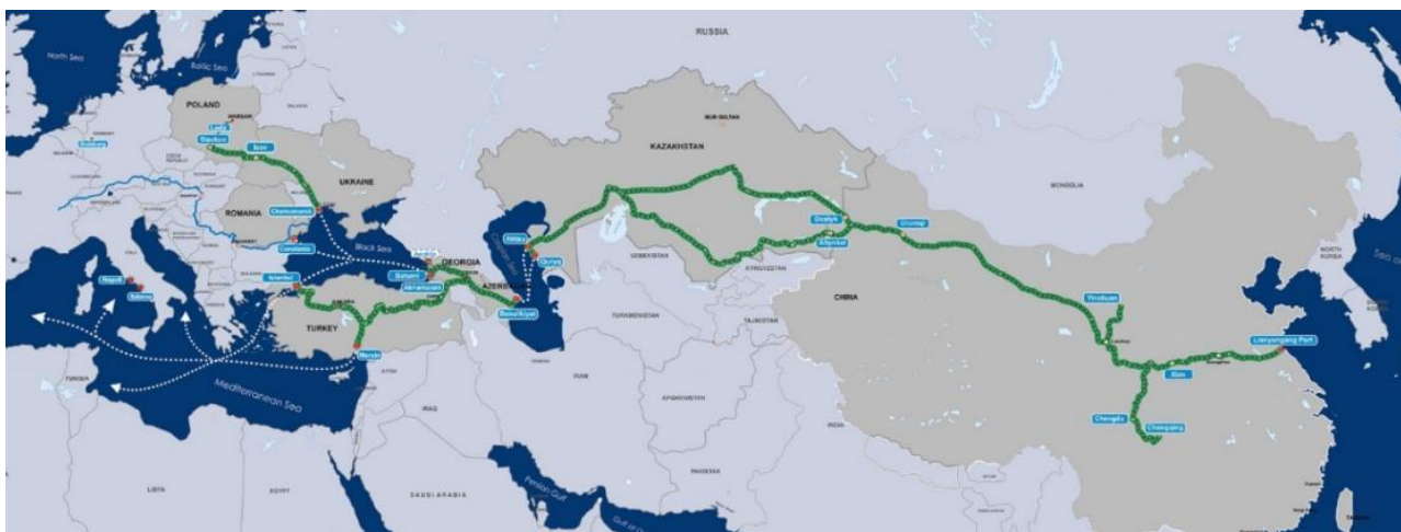
Карта-схема 4. Серединний шлях Китай – Центральна Азія – Європа.

https://www.eeas.europa.eu/eeas/central-asia%E2%80%99s-growing-importance-globally-and-eu_en