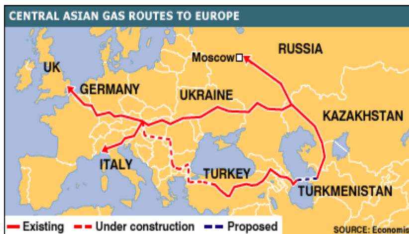
Карта-схема 2. Газові маршрути Туркменістану http://news.bbc.co.uk/1/hi/world/asia-pacific/6649169.stm

Схожа історія з туркменським газом. Традиційно він надходив до Росії по збудованій в радянські часи трубопровідній системі Середня Азія – Центр. По схемі заміщення він потрапляв до України та Європи, а також транзитом через ГТС України. З 2009 року Росія, через штучно створену аварію на газопроводі, різко обмежила імпорту газу з Туркменістану, як такого, що створював конкуренцію постачанням в Україну та ЄС від «Газпрому» (див. карту-схему 2).