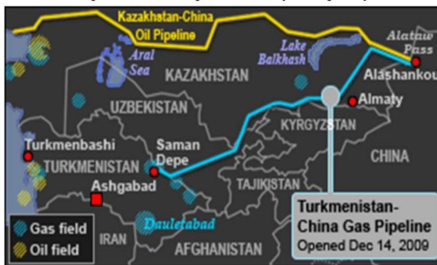
Карта-схема 3. Енергоресурсні експортні маршрути Ц. Азія – Китай

Становищем недостатньої активності ЄС в регіоні, залежністю центральноазійських режимів від РФ, їх залученістю в російські інтеграційні альянси (СНД, ОДКБ, ЄАЕС), протидією РФ диверсифікаційним проектам в європейському напрямку, повною мірою користується Китай. Практично, він замкнув на себе левову частку експорту туркменського газу та частину експорту нафти маршрутом Атасу – Алашанькоу з Казахстану (див. карту-схему 3).