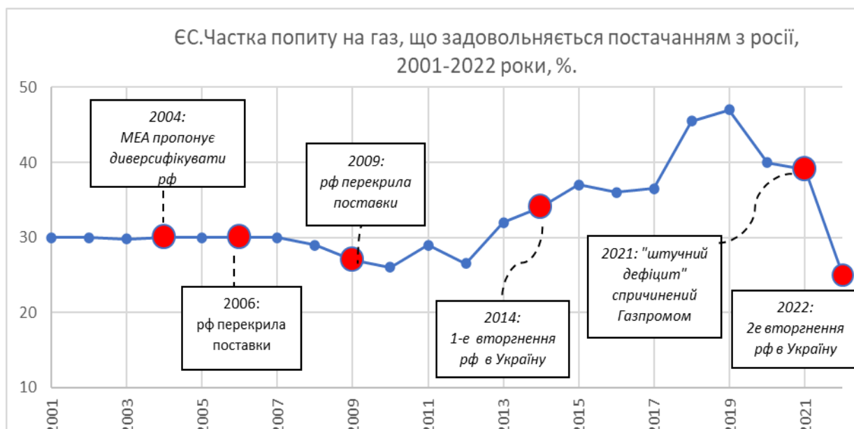
Рис. 1. Частка попиту на газ в ЄС, що задовольняється постачанням з РФ, 2001-2022 р.р., %. Джерело: аналіз Центру "Стратегія XXI" на основі даних МЕА та інших джерел

Одночасно зростала залежність Європейського Союзу від російського газу. Протягом останнього десятиліття, за даними МЕА, частка російського газу, як трубопровідного так і скрапленого, в задоволенні загального попиту ЄС зростає з 30% у 2009 році до 47% у 2019 році (див. Рис. 1). Практично, Євросоюз та його провідна економічна та політична потуга Німеччина, самі того не усвідомлюючи, увімкнули путінській Росії на початку 2000-х «зелене світло» на реалізацію старого, часів холодної війни, плану узалежнення Європи від енергоресурсів з СРСР.